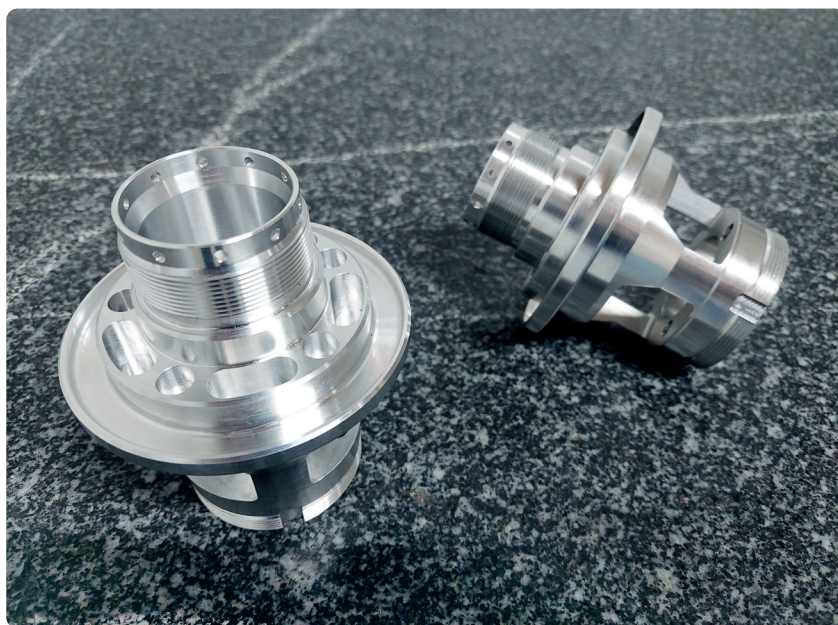
Mit den Lösungen von HSi verteilt ADD die Arbeitsplanung und Auftragssteuerung auf mehreren Schultern und sorgt für mehr Transparenz und Nachvollziehbarkeit. // With HSi's solutions, ADD distributes the burden of work planning and job control over multiple shoulders, providing greater transparency and traceability.

When the search for a replacement of the manual calculations in paper form began, it was clear that the new IT solution should offer a fast and uncomplicated registration and control of orders, a high degree of